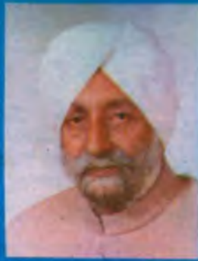
S. Beant Singh Chief Minister