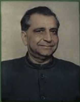
Sh. Harnam Dass Johar Education Minister, Punjab