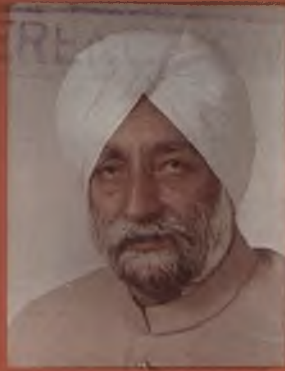
S. Beant Singh Chief Minister, Punjab