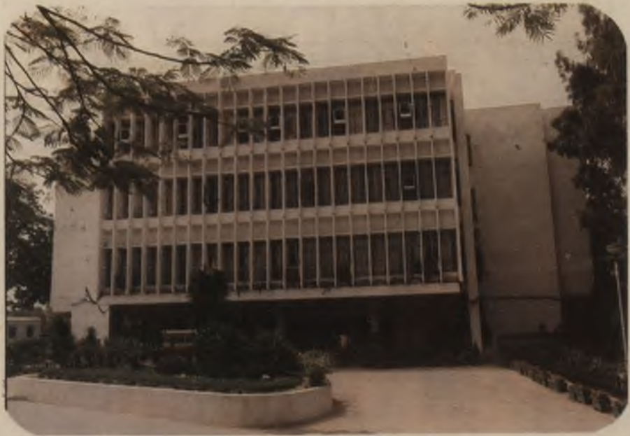
— संस्थान के मुख्य भवन का एक दृश्य