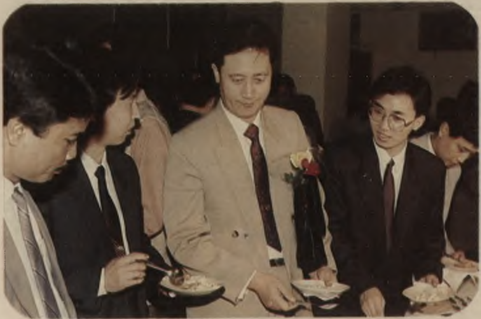
— यूनीसेफ द्वारा प्रायोजित एक कार्यक्रम में चीनी भागीदार