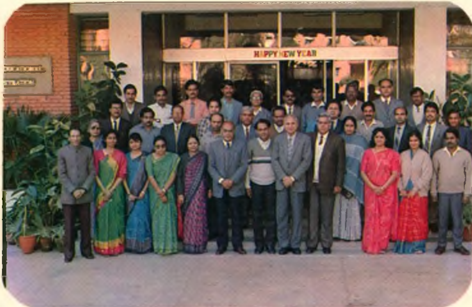
— नीपा के शिक्षाकर्मियों के साथ डिप्लोमा कार्यक्रम के भागीदार