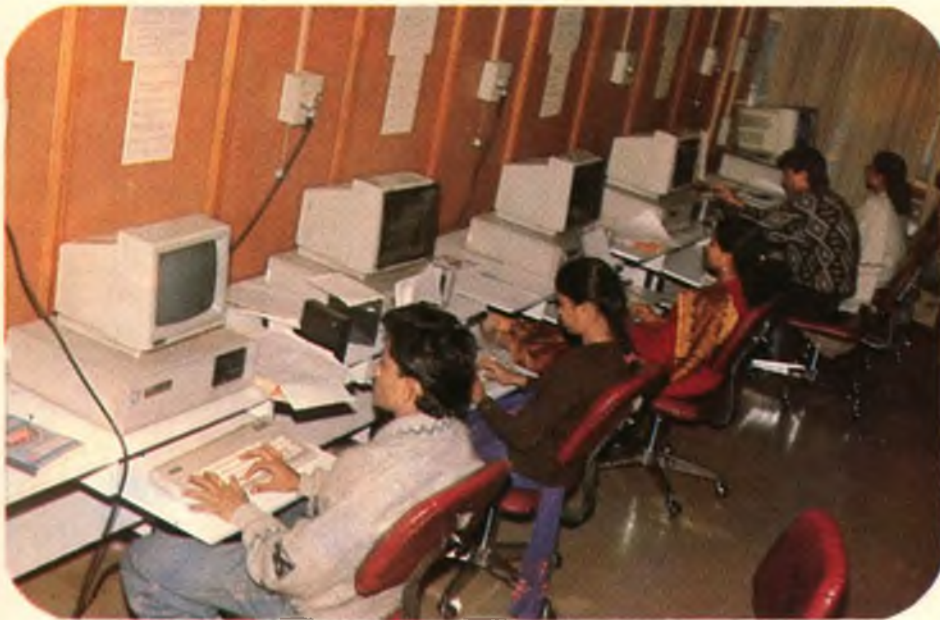
— संगणक कक्ष में कार्यरत लोग