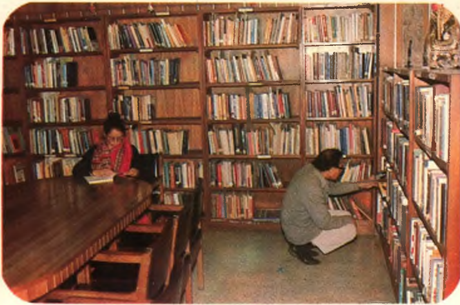
— नौपा पुस्तकालय की एक झलक