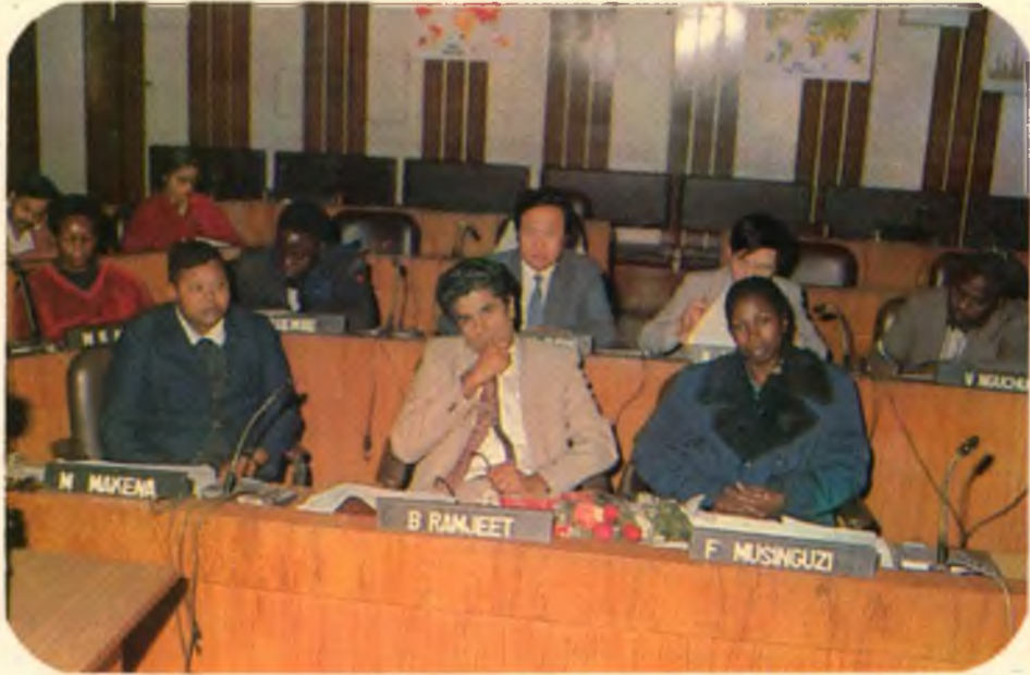
— अंतर्राष्ट्रीय डिप्लोमा कार्यक्रम का एक सत्र