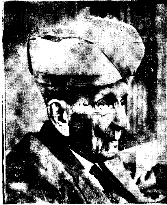
ಸರಣಿ|| ಎಂ. ವಿಶ್ವೇಶ್ವರಯ್ಯನವರು