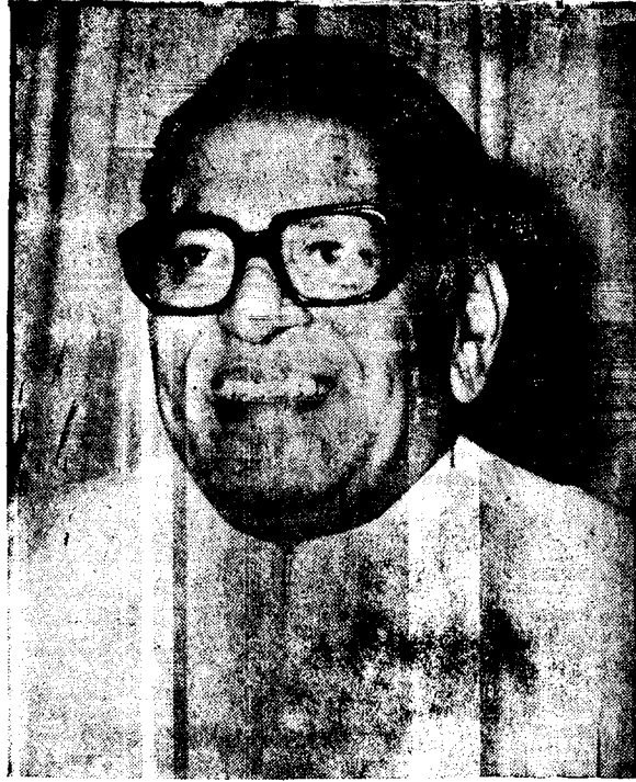
ಶ್ರೀ ಎಸ್. ಆರ್. ಬೊಮ್ಮಾಯಿ ಕರ್ನಾಟಕ ರಾಜ್ಯದ ಮುಖ್ಯಮಂತ್ರಿಗಳು